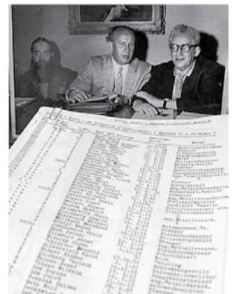
Прочутият списък на работниците на Оскар Шиндлер (в средата).